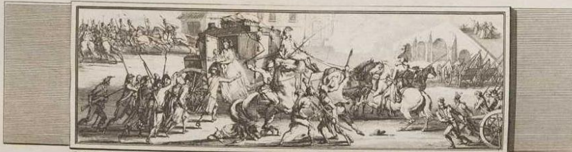
MARIE ANTOINETTE JOSEPHIE JEANNE DE LORRAINE, ARCHIDUCHESSE D'AUTRICHE, DERNIERE REINE DE FRANCE, NÉE À VIENNE LE 2 NOV. 1753; MARIÉE À LOUIS XVI. LE 16 MAI 1770; et jugée le 16 Octobre 1793.

On ne peut songer à Marie Antoinette, sans faire de profondes réflexions sur les vicissitudes humaines. Antoinette avoit reçu du ciel tout ce qui peut procurer le bonheur; si, pour l'obtenir, il faut une naissance illustre réunie à tous les dons de la nature et de la fortune. Cette Princesse joignoit l'esprit et les grâces à une figure majestueuse et séduisante: son caractère étoit ferme, son âme élevée, chérie des Français pendant les premières années de son règne, elle faisoit les délices d'une Cour brillante, mais entièrement corrompue. La vérité de l'histoire ne nous permet pas de taire, qu'elle ruina la France par des dépenses exorbitantes, et l'opinion publique l'a accusée, avec juste raison, d'avoir entravé la marche de la révolution par son ascendant sur l'esprit du Roi, et surtout en lui donnant le perfide conseil de fuir hors du Royaume. Rien ne pourra la justifier à cet égard, quand même on alléguerait les craintes qu'elle avoit lui causer les vues ambitieuses et secrètes du Duc d'Orléans.